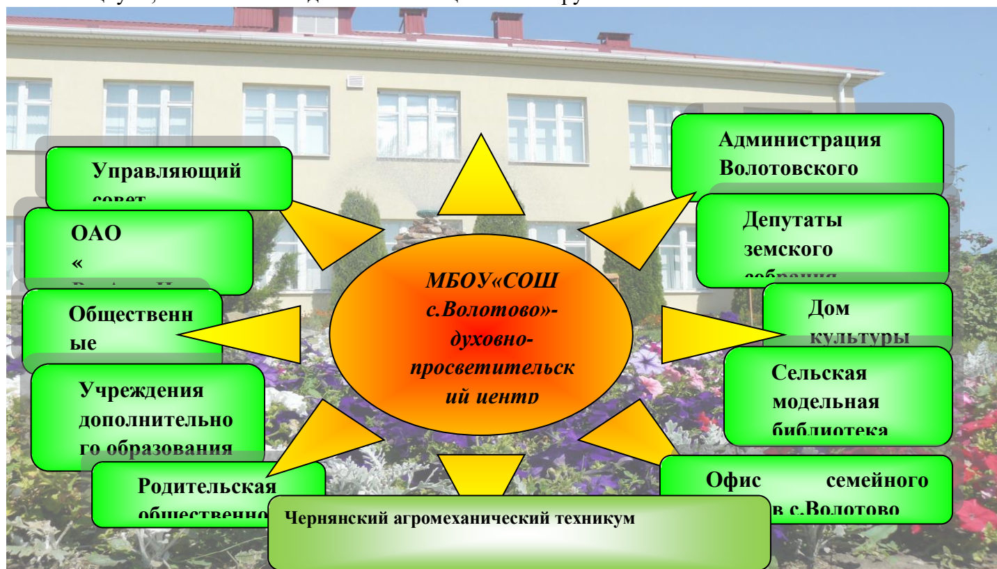
Рис. 1. Социокультурная среда школы